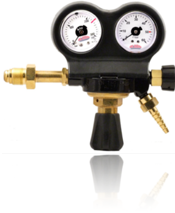
UYUMLU GAZLAR TYPE OF GAS SIZE

Ürün detayları gazlara ve basınçlarına göre değişiklik gösterir.